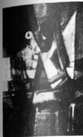
Sundvall, Ruotsi 1973, Göteborg, Ruotsi 1975. - Palkinnot: III palk. Turun kaup:n seinämaalauskilp:ssa 1967. - Kokoelmat: Turun ja Kuopion kaup. sekä Taidetta kouluihin-yhd. Ul- komailla: Sabbasberg Vårdhem, Tuk- holma. - Turun TS:n ja Turun TY:n jäs. -1965, Turun TS:n hall:n jäs. 1967. - Asuu Turussa.